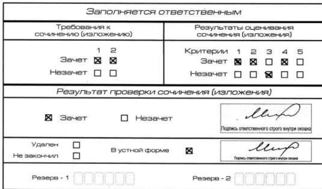
Рис. 11. Область для оценки работы сочинения (изложения) в устной форме